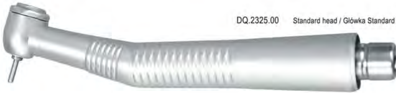
DQ.2325.00 Standard head / Główka Standard

Standard Torque, push button chuck Główka Standard, wymiana wiertel za pomocą przycisku