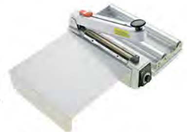
DQ.9000.00 Complete with roll stand and working table Komplet zawiera stojak na rękaw i stolik