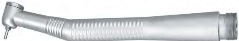
DQ.2475.02 2-holes Borden / złącze 2-otworowe Borden DQ.2475.04 4-holes Midwest / złącze 4-otworowe Midwest Standard Head / Główka Standard

Standard Torque, wrench type chuck, ceramic bearing Główka Standard, mocowanie wiertel za pomocą klucza, łożyska ceramiczne