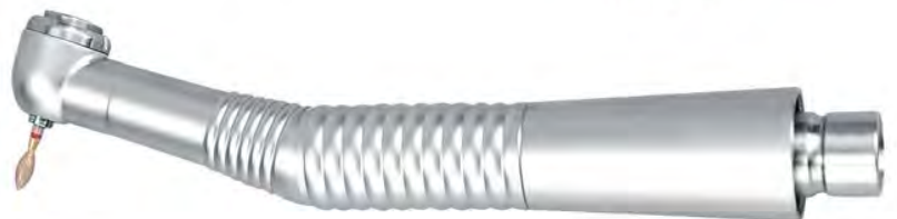
DQ.2200.00 Mini head / Główna Mini