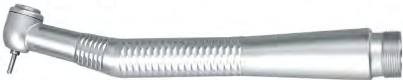
DQ.2425.02 2-holes Borden / złącze 2-otworowe Borden DQ.2425.04 4-holes Midwest / złącze 4-otworowe Midwest Standard Head / Główka Standard

Standard Torque, push button chuck, ceramic bearing Główka Standard, wymiana wiertel za pomocą przycisku, łożyska ceramiczne