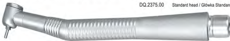
DQ.2375.00 Standard head / Główka Standard

Standard Torque, wrench type chuck Główka Standard, mocowanie wiertel za pomocą klucza